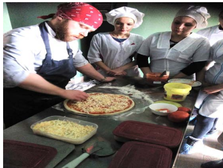
Мастер-классы в ресторанах города