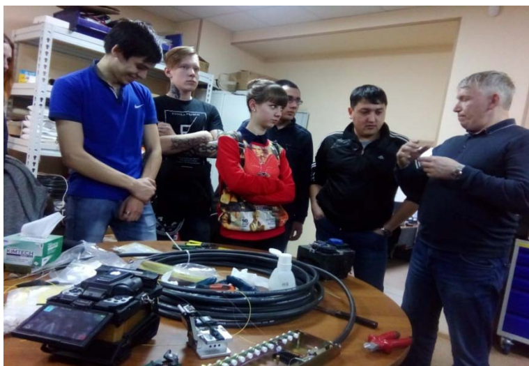
Экскурсия на предприятие